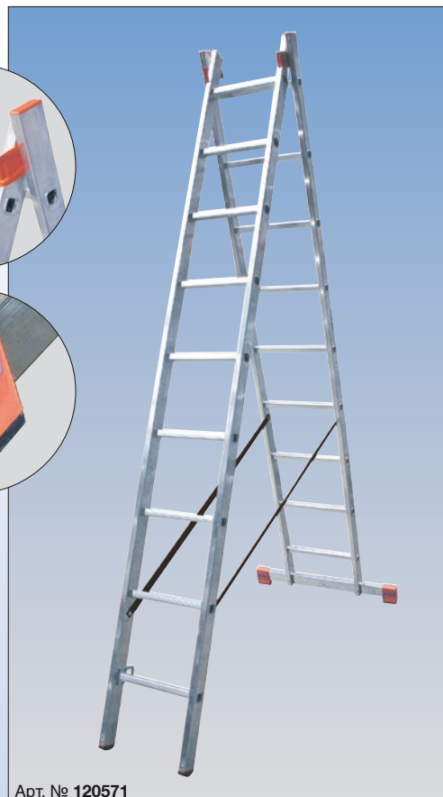
Арт. № 120571